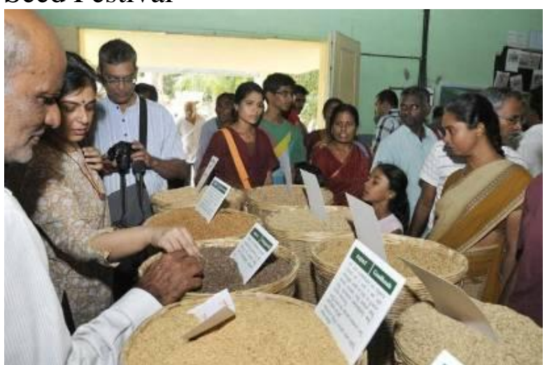
Good turnout: People flocked to the Bangalore Seed Festival held at the Veterinary College campus in Hebbal in Bangalore on Saturday.

The seed festival on Saturday was buzzing with activity and filled with heterogeneous crowd consisting of scores of farmers, students, researchers who came to look at the rich heritage of traditional seed diversity. As many as 600 varieties of paddy seeds, 150 varieties of millet seeds and eight varieties of pulse seeds were on display in around 40 stalls at the seed festival organised by Sahaja Samrudha and Alliance for Sustainable and Holistic Agriculture (ASHA).